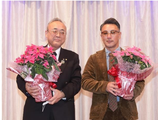
12月結婚記念月御祝 ↑ 12月誕生御祝 →